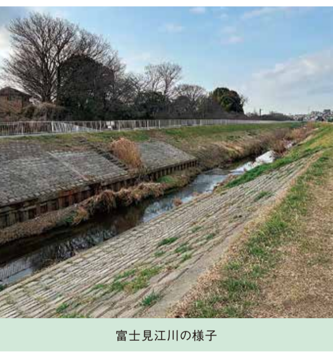
富士見江川の様子

この取組を他の地域へ拡げることについては、市内のどこにおいても町会やボランティアなど多様な主体によるサービス提供を目指しており、町会やまちづくり協議会等に働きかけを考えている。 ②新河岸川右岸河川敷の一部亀裂について Q 本市と埼玉県との対応は。 A 埼玉県職員にて現地確認を行い、緊急性はないことを確認した。市は、原因究明の調査を依頼している。引き続き、サイクリングコース利用者の安全確保に努めていく。