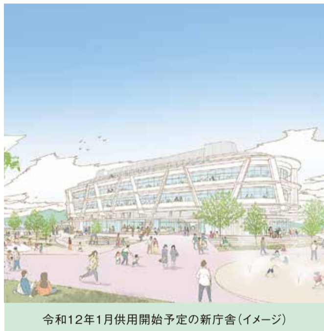
令和12年1月供用開始予定の新庁舎(イメージ)

A 道路においては、夜間ランニングをする方などの安全に配慮する観点も必要と考え、適切な照明の設置を進める。都市公園においては、遊びの中でスポーツに親しめるよう、公園敷地内に広場を整備している。今後、新たに都市公園を整備する際には、意見等をいただいで検討する。