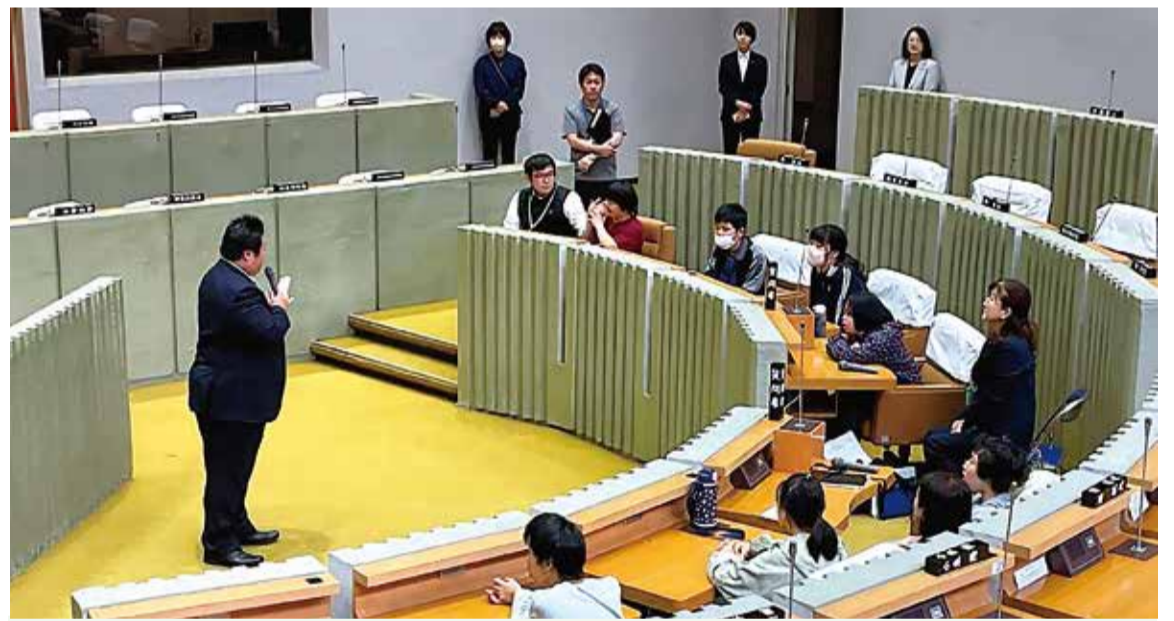
議場での主権者教育の様子

今年度は、中学部2年生7名を対象に、特別活動の時間を活用し、複数回の授業と模擬選挙、富士見市議会議場の見学を組み合わせた主権者教育を行いました。授業では、まず自分たちの暮らしに欠かせないものを出し合い、それらを支える行政や議会、税金の役割について学びました。その後、「自分が議員だったら」という視点で公約を考え、模擬選挙では実際の投票箱や記載台を使った投票体験を実施しました。さらに、議場では、大人数の前で演説を行うという、これまでにない緊張感のある体験にも挑戦しました。