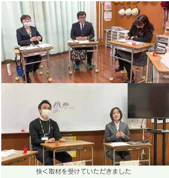
快く取材を受けていただきました

また、今回の授業の流れや教材、指導の工夫を校内で蓄積していくことで、将来的には他の学部、学年でも活用できる「特別支援学校版・主権者教育」として発展させていく可能性もあります。児童生徒の実態や状況に応じて他の学年にも内容が引き継がれ、特別支援学校ならではの主権者教育が形として残っていくよう、校内での話し合いや共通理解を深めていく必要があります。