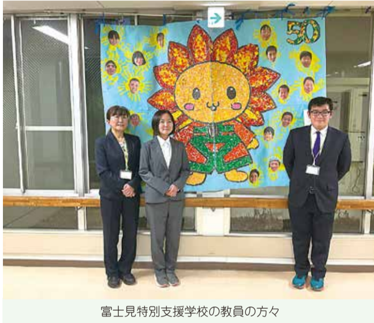
富士見特別支援学校の教員の方々

これまで本校では、「主権者教育」という名称で取り組んできたわけではありませんが、学校行事のスローガンの決定など、候補を出し合い、みんなで選ぶといった民主的な学びを日常の教育活動の中に取り入れてきました。また、授業内容は、「毎年必ず同じことを行う」といった形ではなく、学習指導要領を踏まえ、その年度の子どもの実態に応じて柔軟に対応してきました。将来選挙に参加する子どもたちに対し、段階に応じて「自分で選ぶ」、「自分の意見を持つ」ということを大切にする学びを積み重ねてきました。