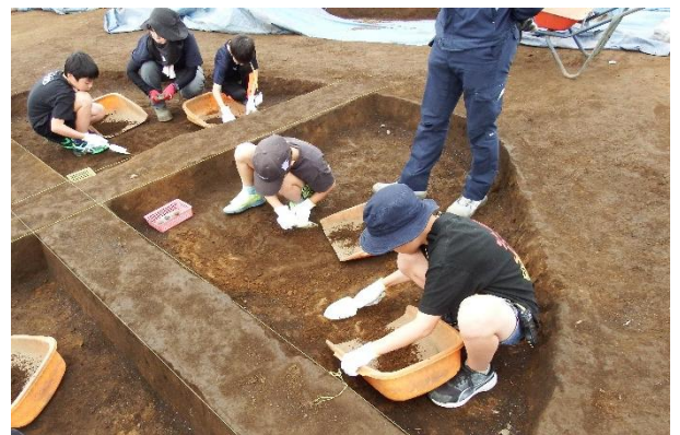
住居跡の発掘体験