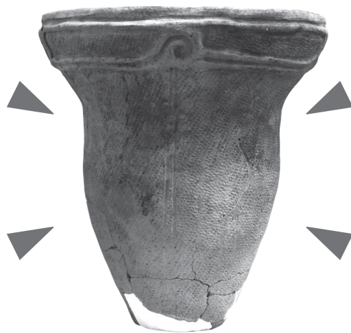
中沢遺跡出土 縄文土器(深鉢)