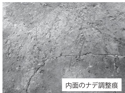
内面のナデ調整痕