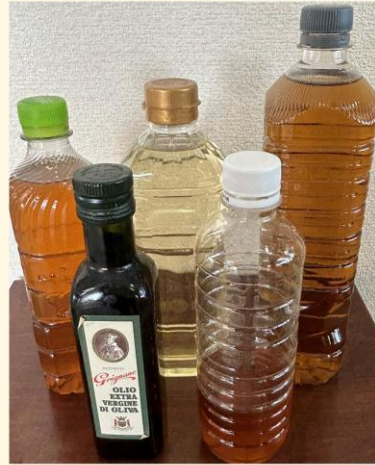
②廃食用油が漏れないようにキャップをよく閉めて回収場所に持参する。