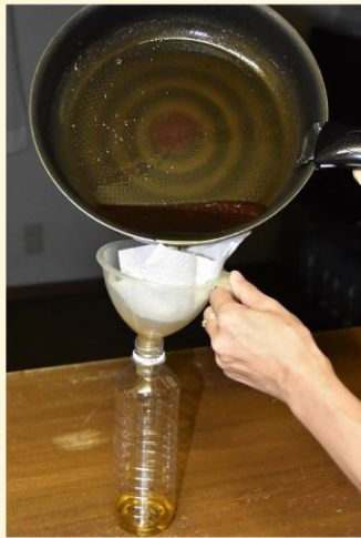
①中身が空になったペットボトルを用意し、冷ました廃食用油を入れる。

ご家庭で使用済みの廃食用油を濾し器などで濾して不純物を取り除いてから、ペットボトルに入れて、回収場所に持参していただき、窓口の職員にお声かけください。