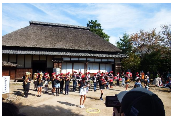
芸能発表（南畑小鼓笛隊）

市内小中学校・幼稚園、和太鼓などの芸能発表、資料館友の会や市民学芸員などの協力による昔体験を実施したほか、南畑幼稚園が作成した「なんばった」の着ぐるみが初披露・寄贈された。また、川越藩火縄銃鉄砲隊による火縄銃演武へは、シャバツ市代表団も参加した。代表団へは、記念品として、ほうき作り伝承会製作による手編み箒を贈呈した。