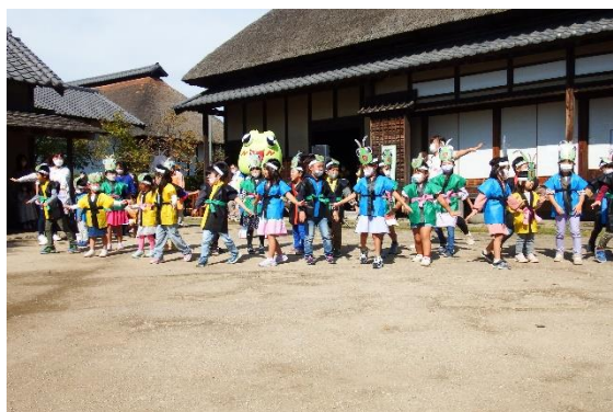
芸能発表（南畑幼稚園）