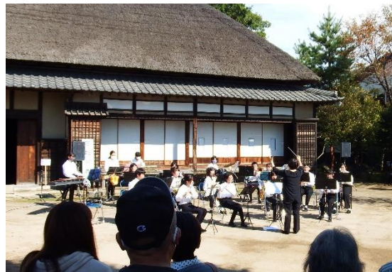
芸能発表（東中吹奏楽部）